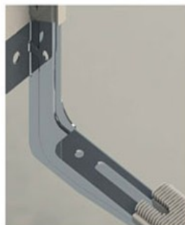
Detalle interior metálico de 2 mm de grosor de una sola hoja doblado y nervado para mayor robustez .