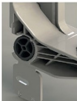
Detalle regulación nivel pared vertical mediante rueda excéntrica integrada .