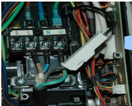
Pulsador de emergencia